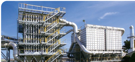
エンジニアリング事業

運用・管理サーバー ■ EdgeProtect 4550 5セッションモデル (Edgewater Networks社製)